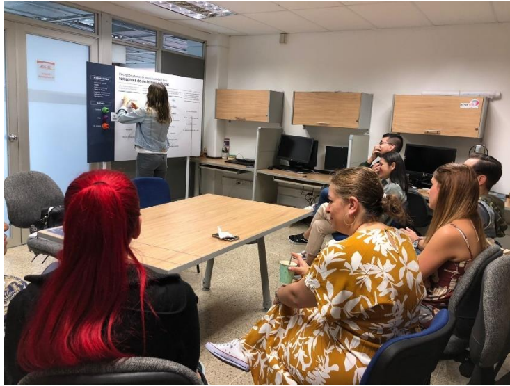
Tabla 2. Participantes en los experimentos